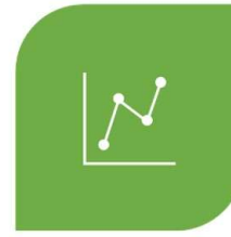
DISPATCH: scenari pandemici e valutazione del rischio epidemiologico. Valutazioni di impatto sulla salute e sui servizi sanitari