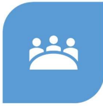
Rete italiana di preparedness pandemica