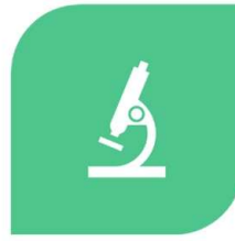
MiRiK: valutazione microbiologica del rischio pandemico