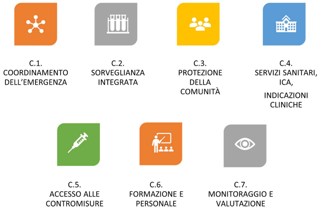
Figura 2. Sistemi e capacità per la preparazione e la risposta

Nella sezione "D. Fasi operative, segnali e valutazione del rischio" viene descritto l'approccio metodologico operativo per la gestione delle allerte internazionali e nazionali, la valutazione del rischio, i principali parametri per l'interpretazione epidemiologica della pandemia e la valutazione del rischio, la