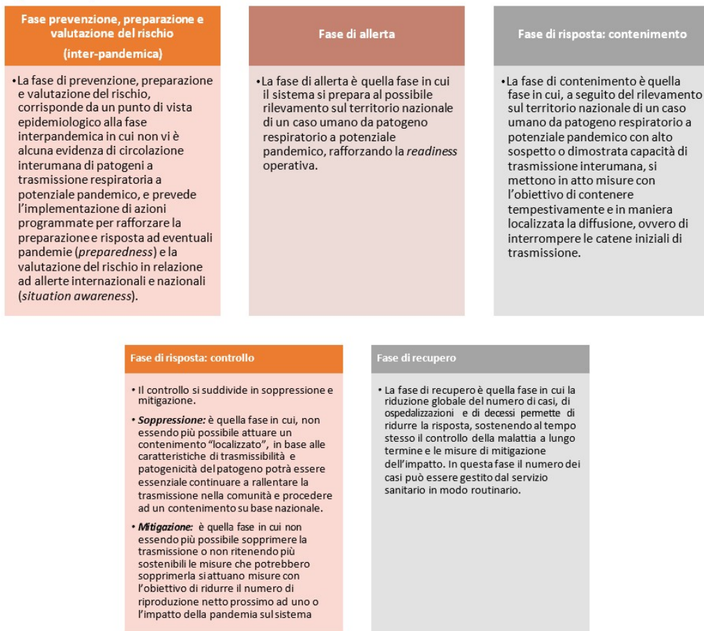
Figura 5. Fasi operative

La fase di recupero è quella fase in cui la riduzione globale del numero di casi, di ospedalizzazioni e di decessi permette di ridurre la risposta, sostenendo al tempo stesso il controllo della malattia a lungo termine e le misure di mitigazione dell'impatto. In questa fase il numero dei casi può essere gestito dai servizi del sistema sanitario in modo routinario.