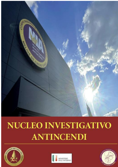
Nucleo Investigativo Antincendi 2004 - 2024 - Data pubblicazione: 23/04/2024