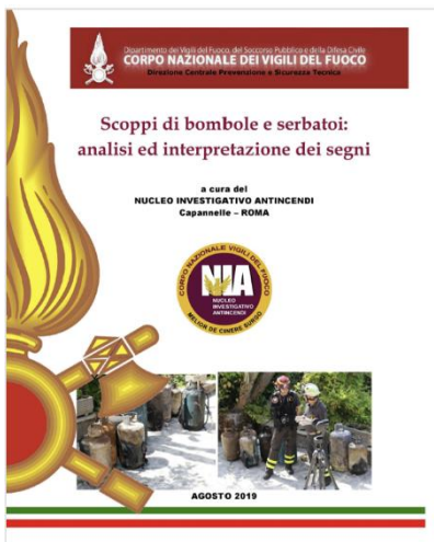
Scoppi di bombole e serbatoi: analisi ed interpretazione dei segni - Data pubblicazione: 30/08/2019