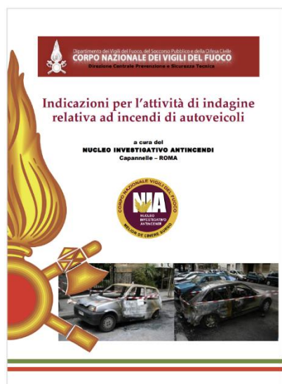
Indicazioni per l'attività di indagine relativa ad incendi di autoveicoli - Data pubblicazione: 25/11/2016