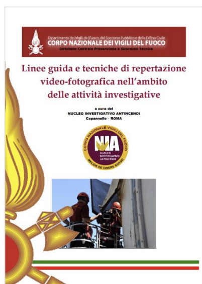
Linee guida e tecniche di repertazione video-fotografica nell'ambito delle attività investigative - Data pubblicazione: 20/07/2016