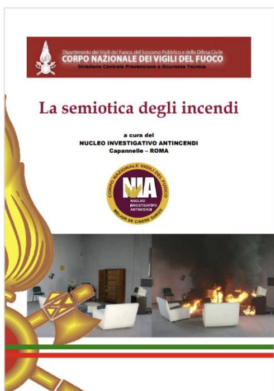
La semiotica degli incendi - Data pubblicazione: 25/11/2015