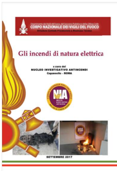
Gli incendi di natura elettrica - Data pubblicazione: 26/09/2017