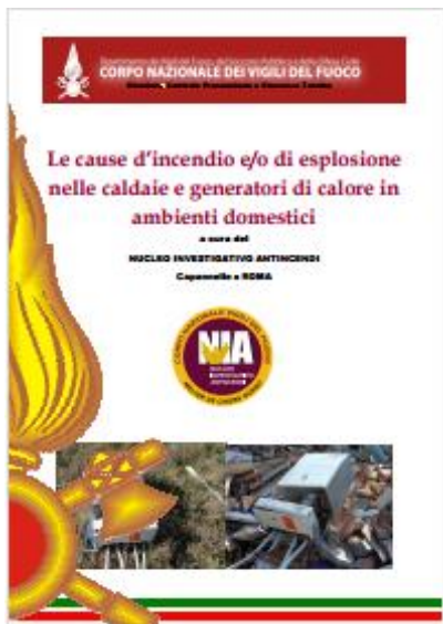
Le cause d'incendio e/o di esplosione nelle caldaie e generatori di calore in ambienti domestici - Data pubblicazione: 18/02/2016