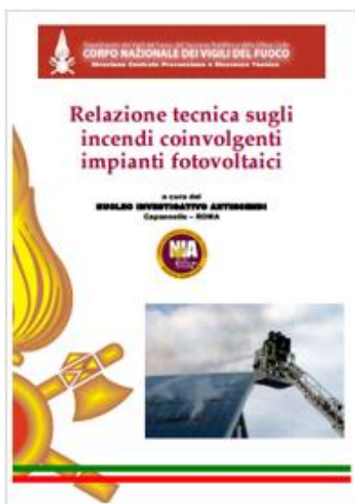
Relazione tecnica sugli incendi coinvolgenti gli impianti fotovoltaici - Data pubblicazione: 20/10/2015